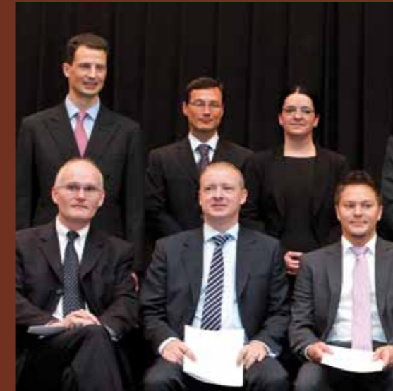
Die frisch ausgezeichneten Diplomanden