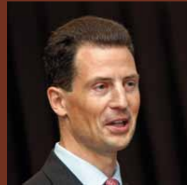
SD Erbprinz Alois von und zu Liechtenstein hält an der Promotionsfeier die Festrede.