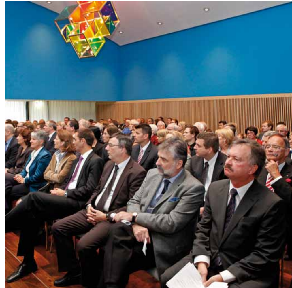
Die Gäste der Promotionsfeier während der Festrede von SD Erbprinz von und zu Liechtenstein